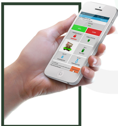
Contrôlez votre vanne connectée depuis votre smartphone ou tablette

La vanne connectée STREGA à calendrier embarqué est une vanne wireless autonome dotée de la technologie LoRaWAN® . Grâce à sa consommation d'énergie extrêmement faible, la vanne connectée permet les opérations d'ouverture/fermeture à distance au travers d'un réseau LoRa privé ou opéré. La vanne fonctionne sur piles pendant plus de 10 ans - ou via une alimentation externe si utilisation en Classe C - et sur des distances extrêmement longues, avec une pénétration exceptionnelle à l'intérieur de bâtiments.